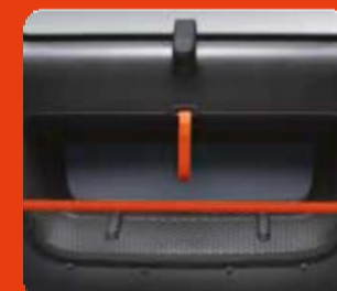
2 δίκτυα αποθήκευσης εσωτερικά των θυρών με πορτοκαλί διακοσμητικό χρώμα