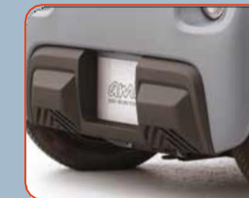
Προστατευτικά στον εμπρός προφυλακτήρα