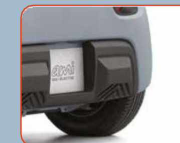
Προστατευτικά στον πίσω προφυλακτήρα