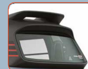
Μαύρη αεροτομή στο πίσω μέρος της οροφής