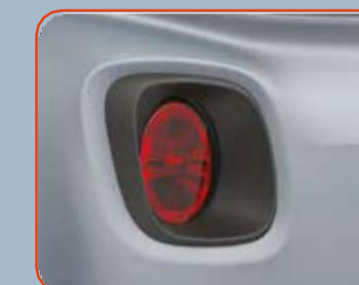
Διακοσμητικό μαύρο περίβλημα στα πίσω φώτα