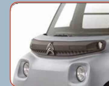
Διακοσμητικό μπροστινής μάσκας σε χρώμα μαύρο