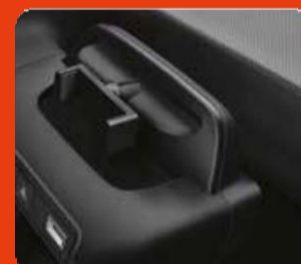
Θήκη τοποθέτησης smartphone