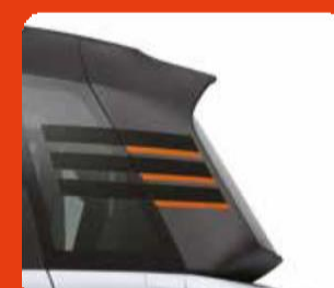
Αυτοκόλλητα πίσω τζαμιών σε χρώμα πορτοκαλί-μαύρο