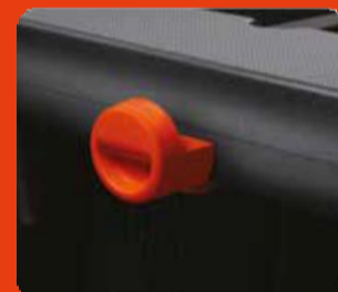
Γάτζος συγκράτησης τσάντας στην πλευρά του συνοδηγού σε χρώμα πορτοκαλί