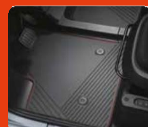
Μαύρα πατάκια δαπέδου