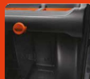
Κεντρικό διαχωριστικό δίκτυ