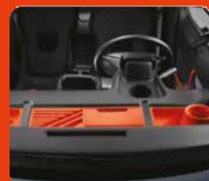
3 χώροι αποθήκευσης στο ταμπλό σε πορτοκαλί χρώμα